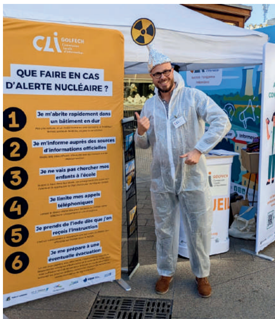
Photo du stand de la CLI de Golfech au Village de la Sécurité Civile, organisé par le cabinet Krisis Conseil, dans le cadre des Journées Nationales de la Résilience.