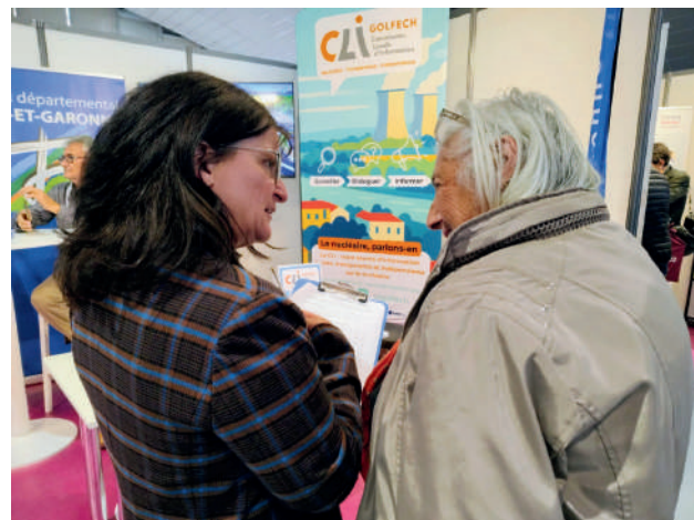
Sur le stand de la CLI aux salons des maires de Tarn-et-Garonne, gracieusement hébergé par le Conseil Départemental de Tarn-et-Garonne.